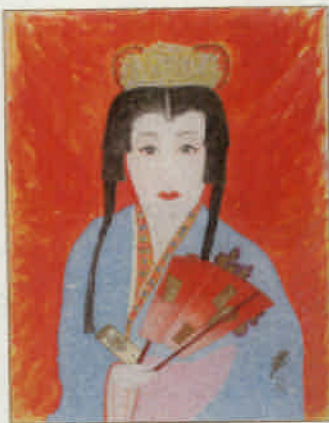
美空ひばり 自画像 (春秋千載絵巻)