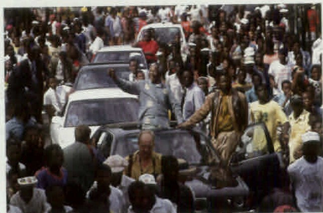
高橋邦典「マンデラの行進」

今回は最大規模で100名の方々からご出展をいただきました。中でも特筆すべきは、南アフリカ共和国第8代大統領、ネルソン・マンデラ氏の世界初になる歴史に残る偉大な方の参加が叶いました。歴史的書物など本邦初公開となる作品の数々を、この機会にご自身の目で確かめ、体感ください。