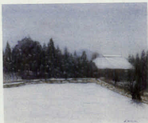
元宿 仁「ふる里冬景色」