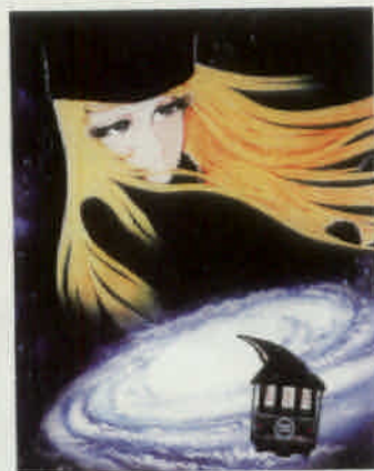
松本零士「さよなら銀河鉄道 999」